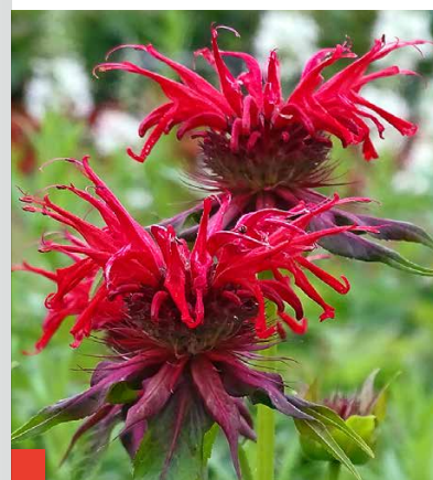
Eigenwillig und unverwechselbar – die fransigen Charakterköpfe der Monarden.