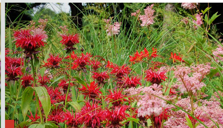
Rosa umwölkt von Mädesüß bieten Monarden und Montbretien eine feurige Show. Oben: M. 'Schneewolke' funkelt vor blauer Kulisse von Agastache 'Blue Fortune'.