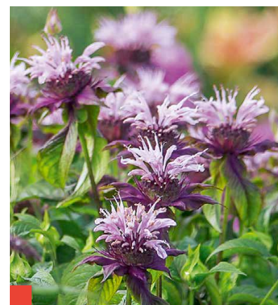
M. 'Beauty of Cobham' präsentiert leuchtende Blüten auf dunklen Hochblättern.