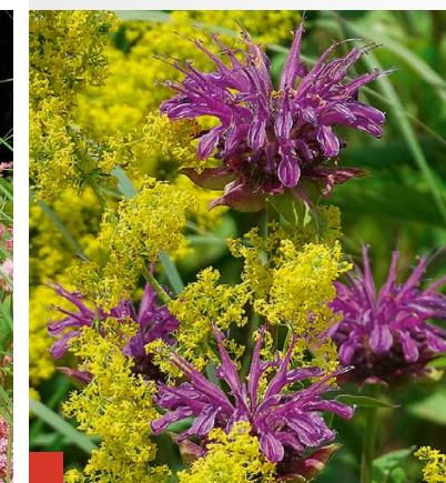
Reizvoller Kontrast zwischen Blütenformen: M. 'Prärienacht' und Galium verum . ...