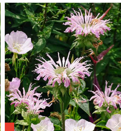
... M. 'Fishes' und Oenothera speciosa . Oben: Monarda ist ein Insektenmagnet.