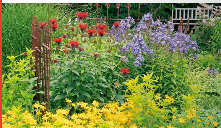
Monarda 'Jacob Cline' im farbenfrohen Zusammenspiel mit Phlox und Coreopsis . Oben: Glanzpunkt auf der Terrasse – Monarden gefällt es auch in Kübeln und Schalen.

auch Flammenblumen ( Phlox ), Dolden-Glockenblumen ( Campanula lactiflora ) und Kugellauch ( Allium ) lassen sich gut mit den eher langsam austreibenden Monarden kombinieren. Wobei, was heißt hier langsam: Die Minzblättrige Monarde ( Monarda fistulosa var. menthifolia )