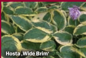
Hosta ,Wide Brim'