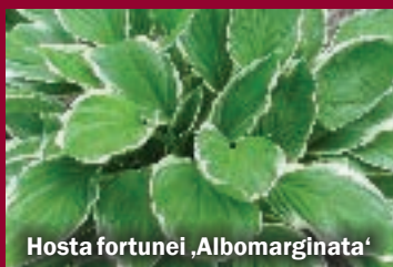
Hosta fortunei ,Albomarginata'