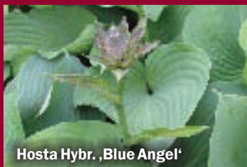
Hosta Hybr. ,Blue Angel'