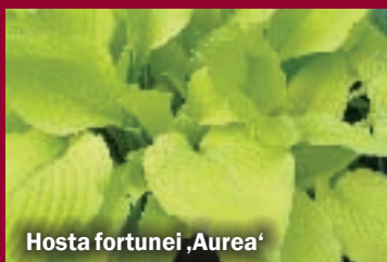
Hosta fortunei ,Aurea'