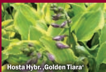
Hosta Hybr. ,Golden Tiara'